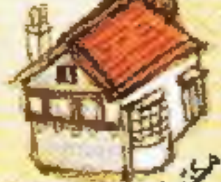
مكتبة بوريس بيلينك